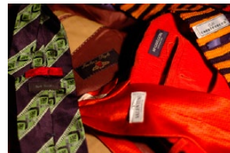
Photo 5. La profusion des accessoires, des marques et des griffes de luxe.

Un classique trois pièces détourné par le jeu des matières et l'accord explosif des couleurs: contraste entre la cravate tricotée et la pochette soyeuse, les deux types de carreaux et le satin de soie de la veste.