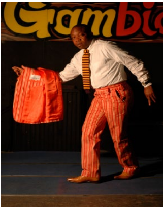
Photo 2. Les couleurs et les motifs.

Audace des mélanges de pois et écossais dans des couleurs solaires et dévoilement de la doublure unie parfaitement assortie.