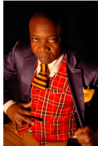
Photo 4. L'assemblage d'un Sapeur.

Le perfectionnisme de la tricologie vient finir avec raffinement la tenue.